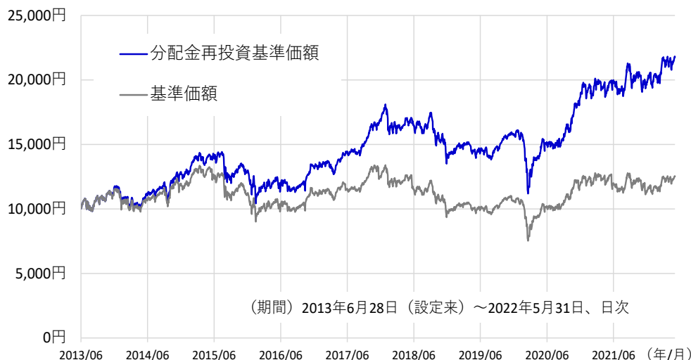
図表1. 設定来の基準価額と分配金再投資基準価額の推移

「新経済成長ジャパン」(以下、当ファンド)の分配金再投資基準価額は、5月30日に過去最高値を更新しました。閉塞感の強い市場環境のなか、設定来の分配金再投資基準価額の年初来騰落率は5月末現在で約9.8%となり、当ファンドは順調にリターンを積み上げております。当レポートでは、足元の投資環境と当ファンドが現在採用している投資戦略についてご案内いたします。