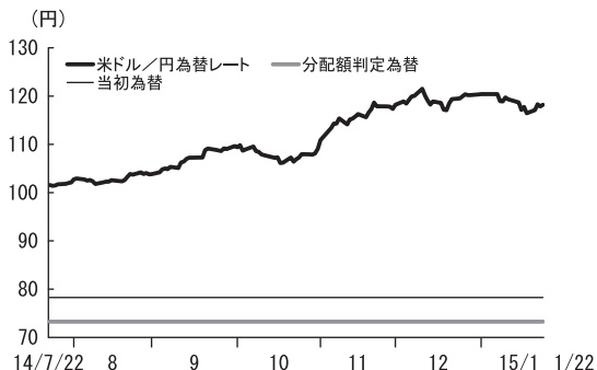
米ドル/円為替レートの推移

クレディ・アグリコル・C I Bの信用スプレッドは、米国や欧州連合によるロシアに対する経済制裁の強化が打ち出されるなど、地政学的リスクの高まりから、拡大する場面もありました。しかし、欧米株価が堅調に推移したことから、概ねレンジ内で安定的な動きとなりました。