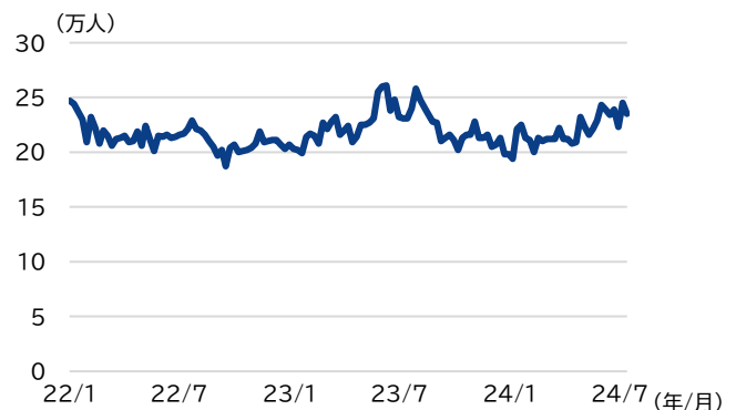
図表2 米国の新規失業保険申請件数 (期間 2022年1月7日～2024年7月19日、週次)